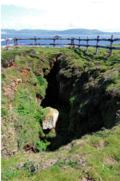
Unha das moitas furnas da costa