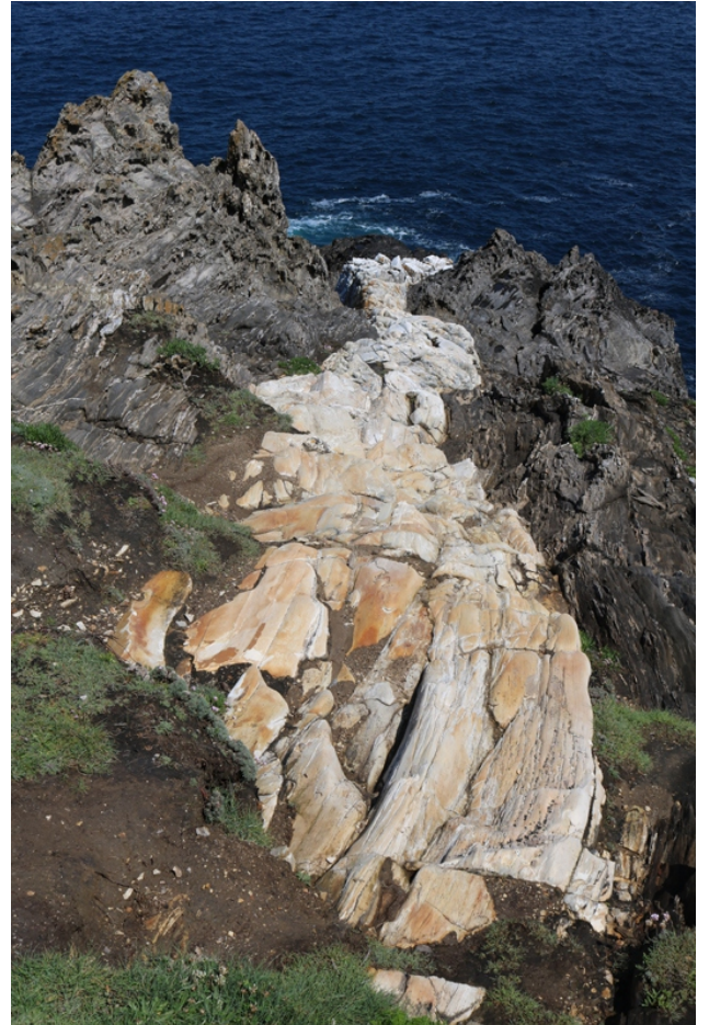
O Seixo Branco

Unha curta camiñada para achegarse, e ver de preto, algúns dos lugares emblemáticos da costa entre rías do Golfo Ártabro: o illote da Marola , coñecido polas numerosas historias e referencias da tradición (maiormente ditos e cantigas), o Seixo Branco , curiosa formación xeolóxica (un dique de cuarcita branca que destaca entre as rochas escuras que o rodean), lugar estratéxico e monumento natural, desde onde se abrangue a enseada de Canaval e Monte Meán, e podemos gozar da panorámica da cara norte da cidade da Coruña rematada pola Torre de Hércules; mentras percorremos unha parte do espazo protexido LIC Costa de Dexo, protexido tamén como Monumento Natural “Dexo-Serantes”, espazo que destaca pola beleza das súas paisaxes e a riqueza de flora e fauna adaptada aos cantís.