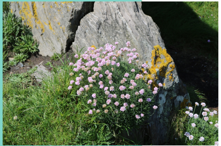
Herba de namorar