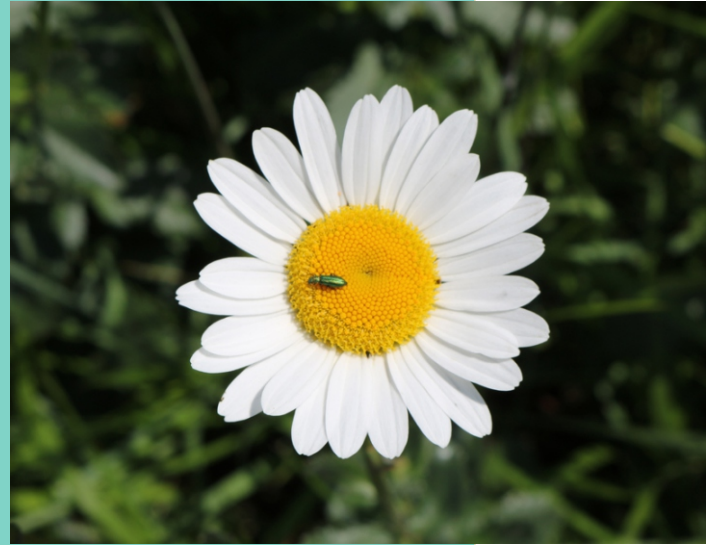
Margarida ( Leucanthemum merinoi )