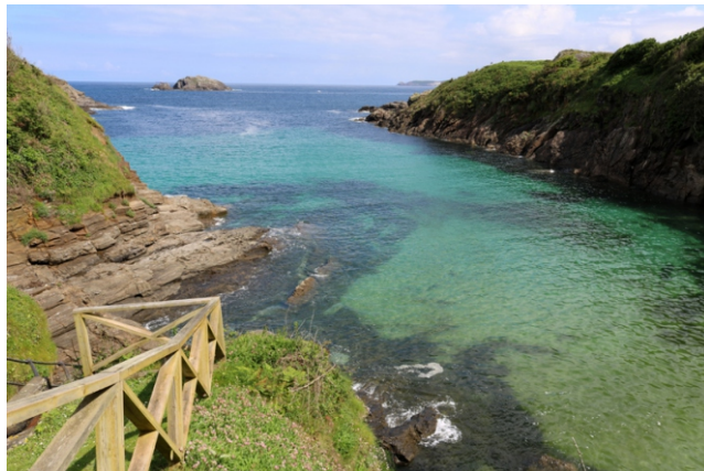
Portiño de Dexo coa Marola ao fondo

Par completar a viaxe podemos achegarnos, en Dexo, a ver a igrexa de Santa María, románica do século XII, e en Mera a lagoa, na que crían lavancos e galiñolas.