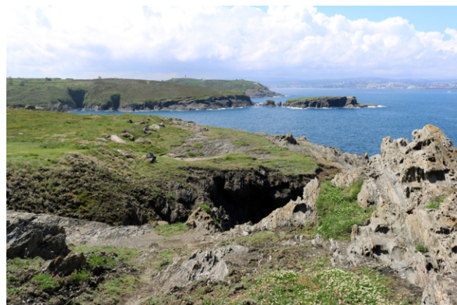
Vista desde o Seixo Branco cara á punta de Mera e A Coruña