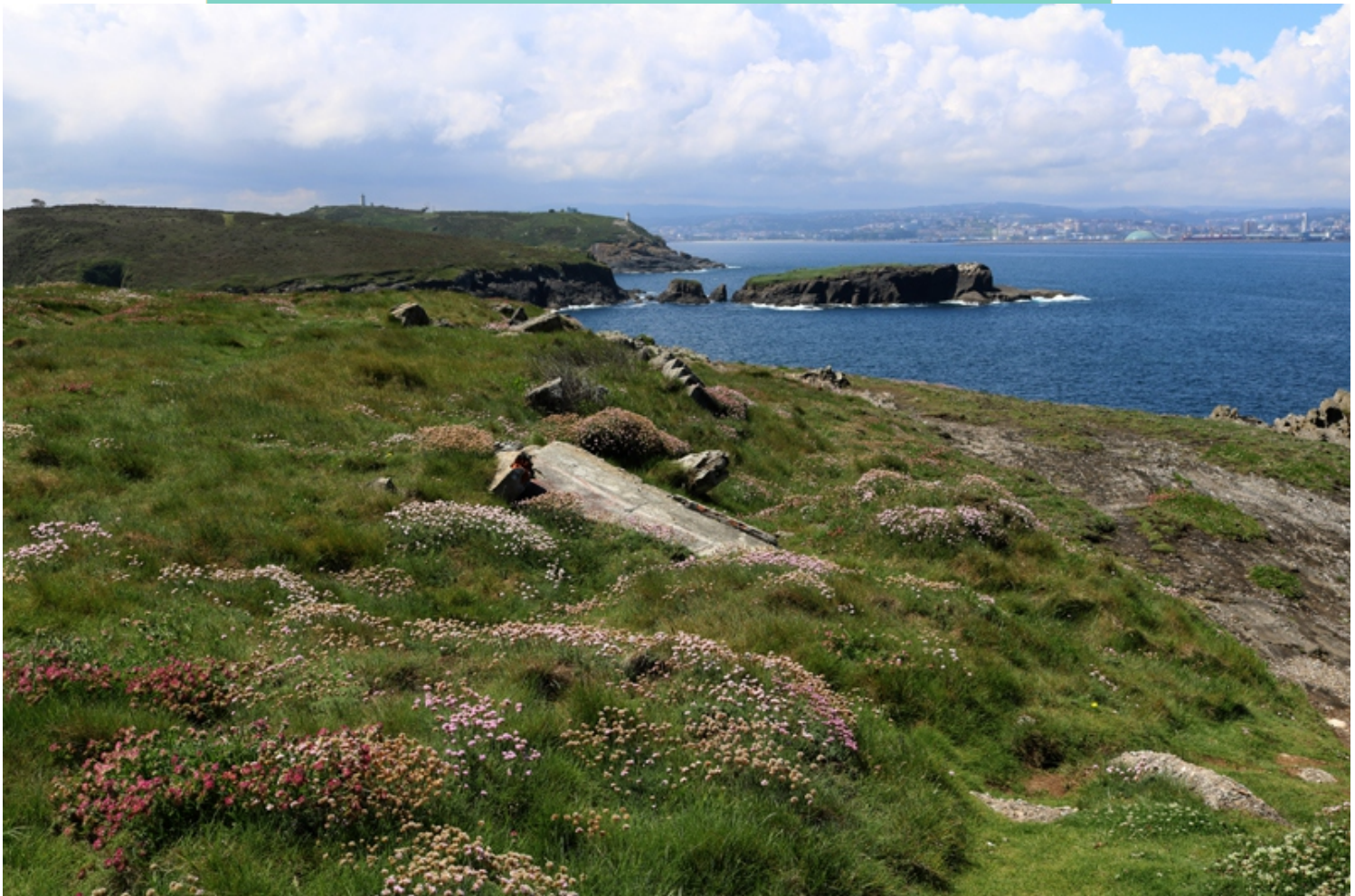
Vista desde o Seixo Branco cara á punta de Mera e A Coruña. No primeiro plano o illote de Monte Meán.