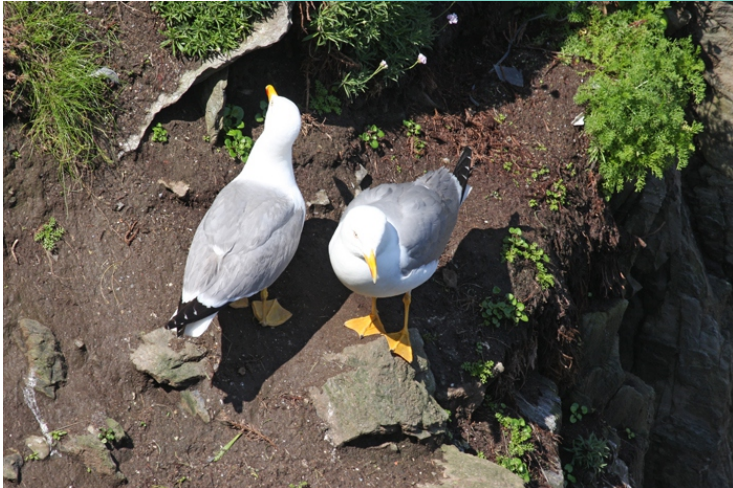
Gaivotas nos cantís onde aniñan