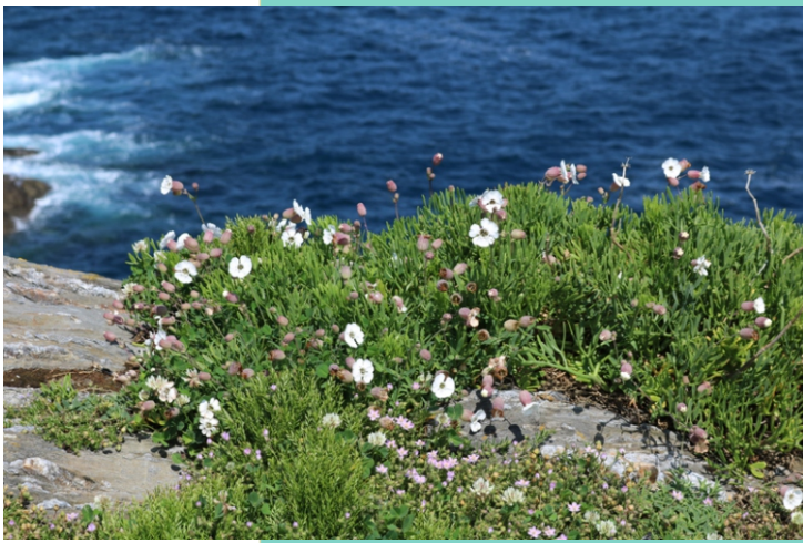
Colexas (en flor) e pirixel do mar